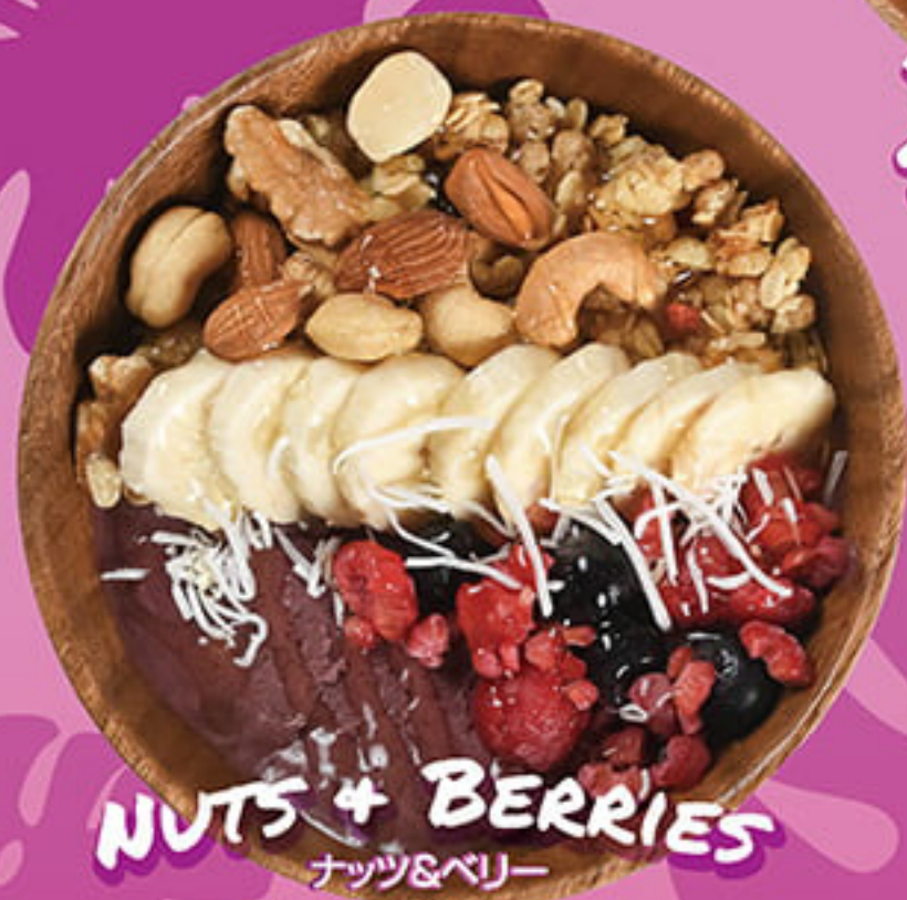
NUTS + BERRIES