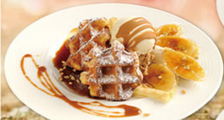
キャラメル焼きバナナの ワッフルクレープ