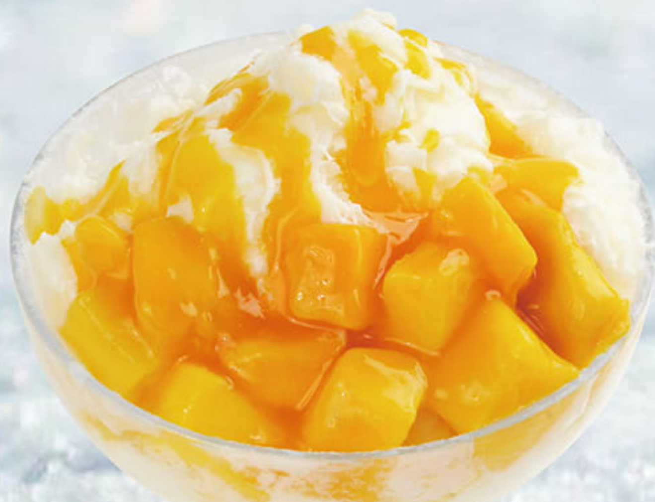
ふわふわミルクかき氷 トロピカルマンゴー ¥980 (税込¥1,078)