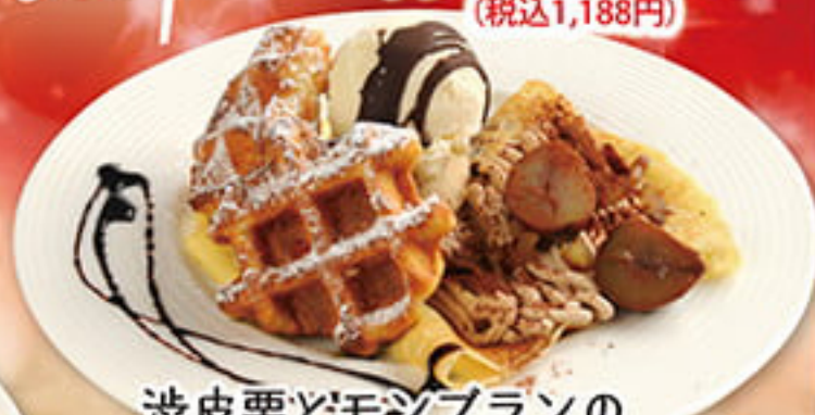
渋皮栗どモジブランの ワッフルクレープ