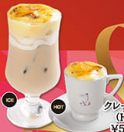
ICE HOT クリームブリュレラテ (HOT/ICE) ¥540 (税込594円)