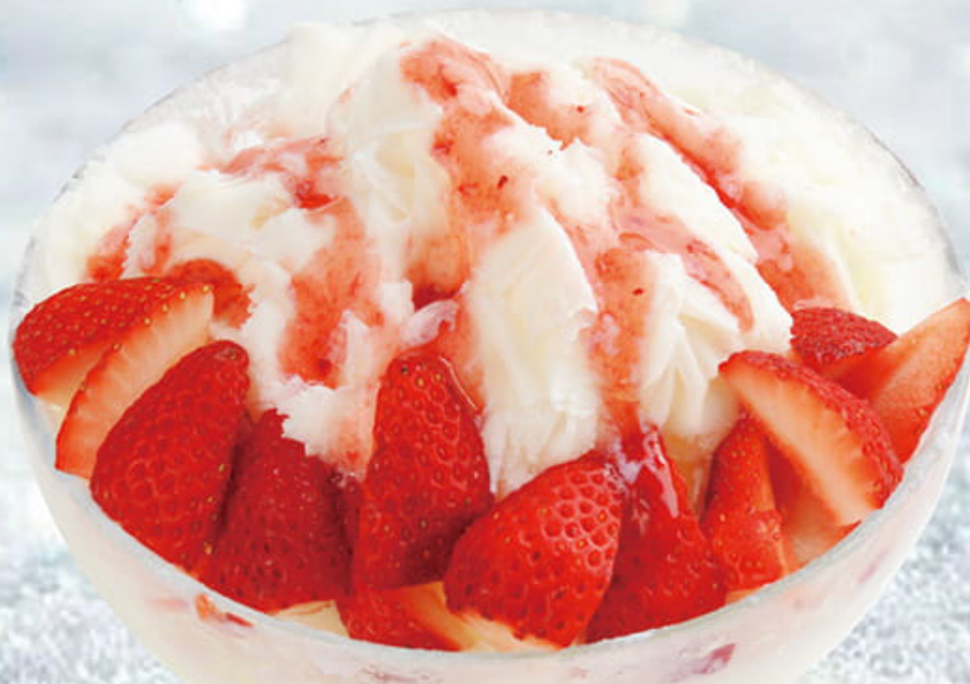
ふわふわミルクかき氷 いちご (※いちごは冷凍を使用しています。) ¥980 (税込¥1,078)