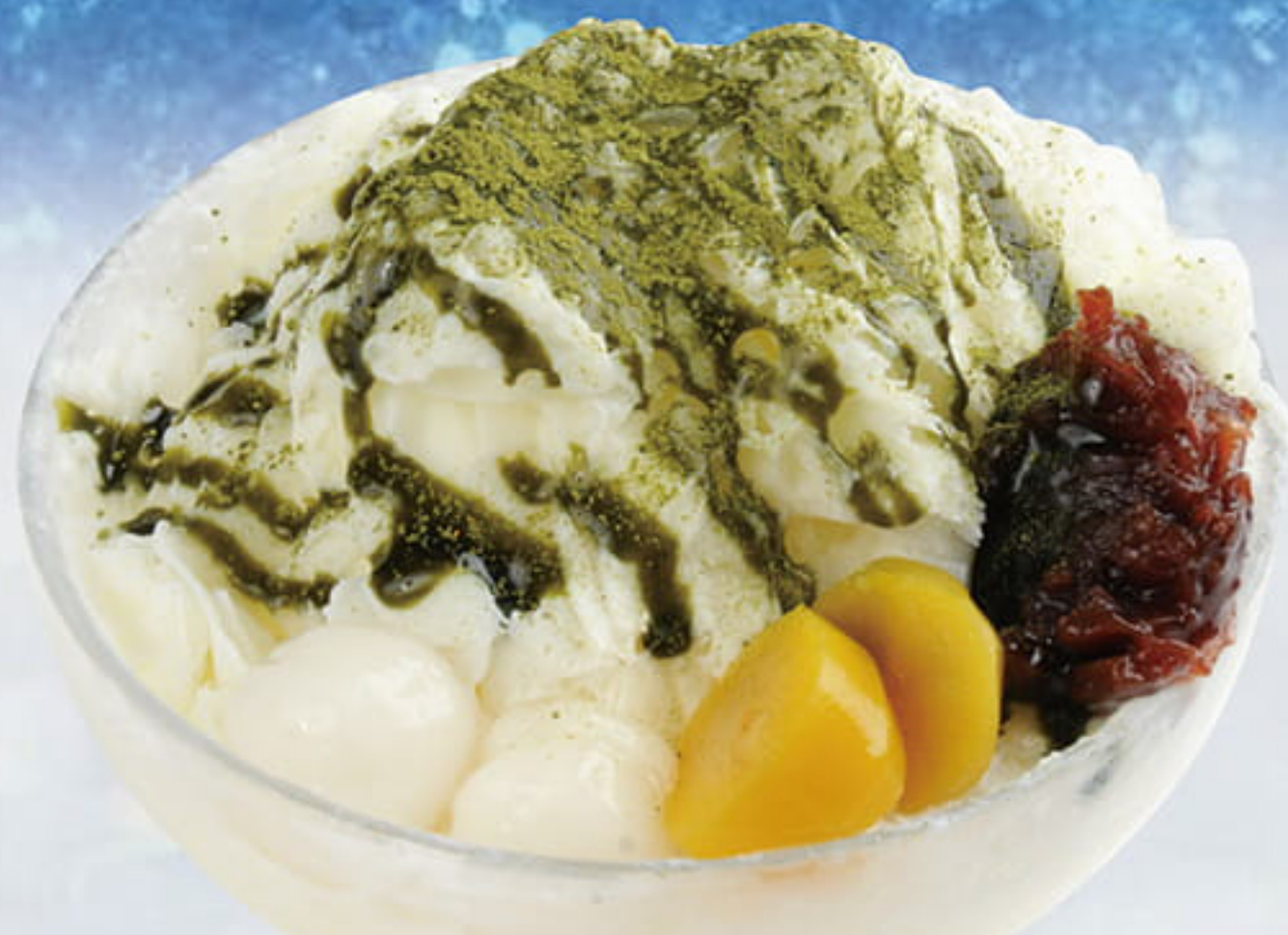
ふわふわミルクかき氷 宇治抹茶 ¥980 (税込¥1,078)