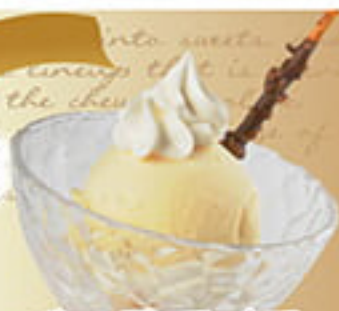
バニラアイス ¥320 (税込352円)