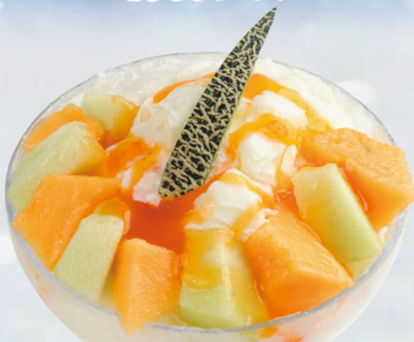
ふわふわミルクかき氷 メロン ¥1,380 (税込¥1,518)