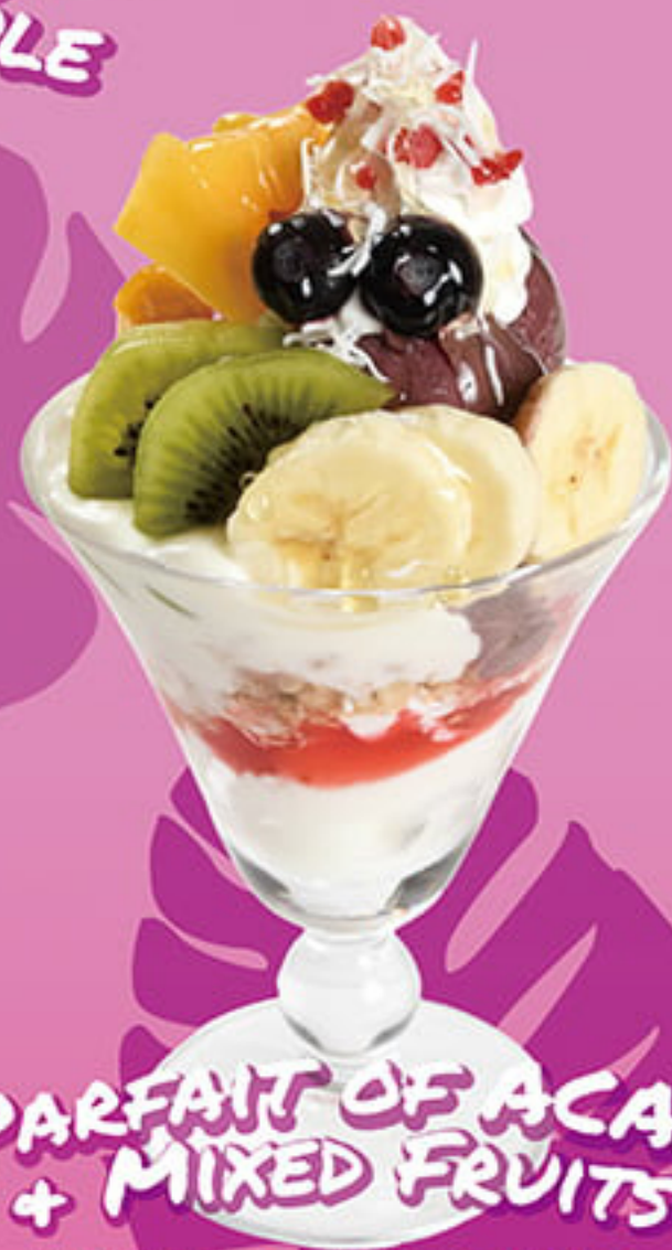
PARFAIT OF ACAI + MIXED FRUITS