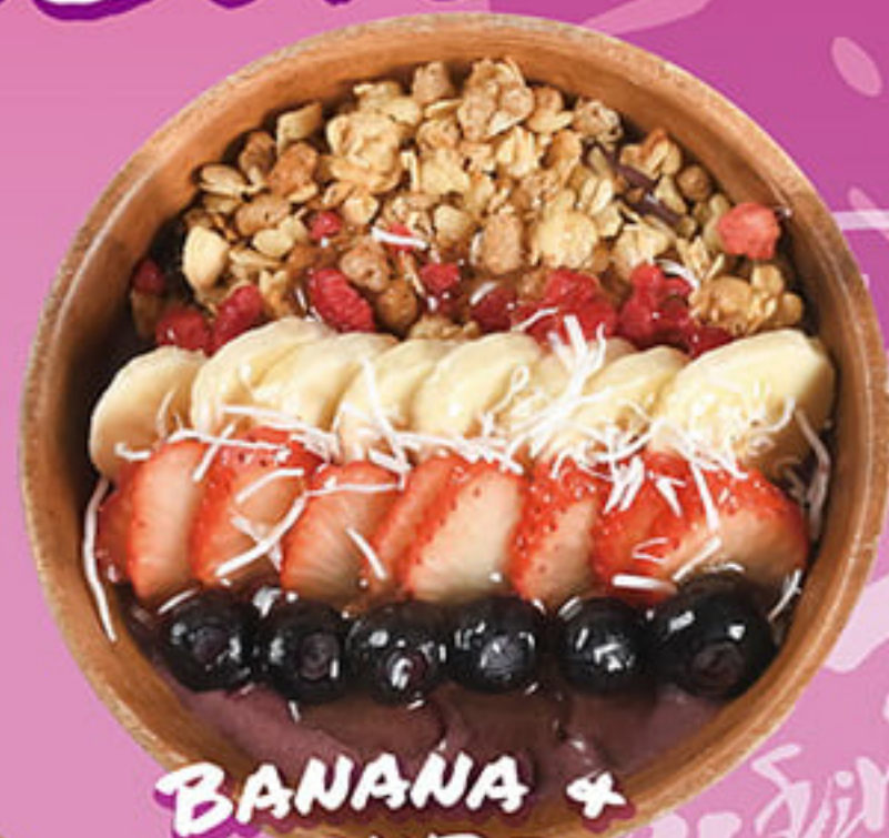
BANANA + STRAWBERRY