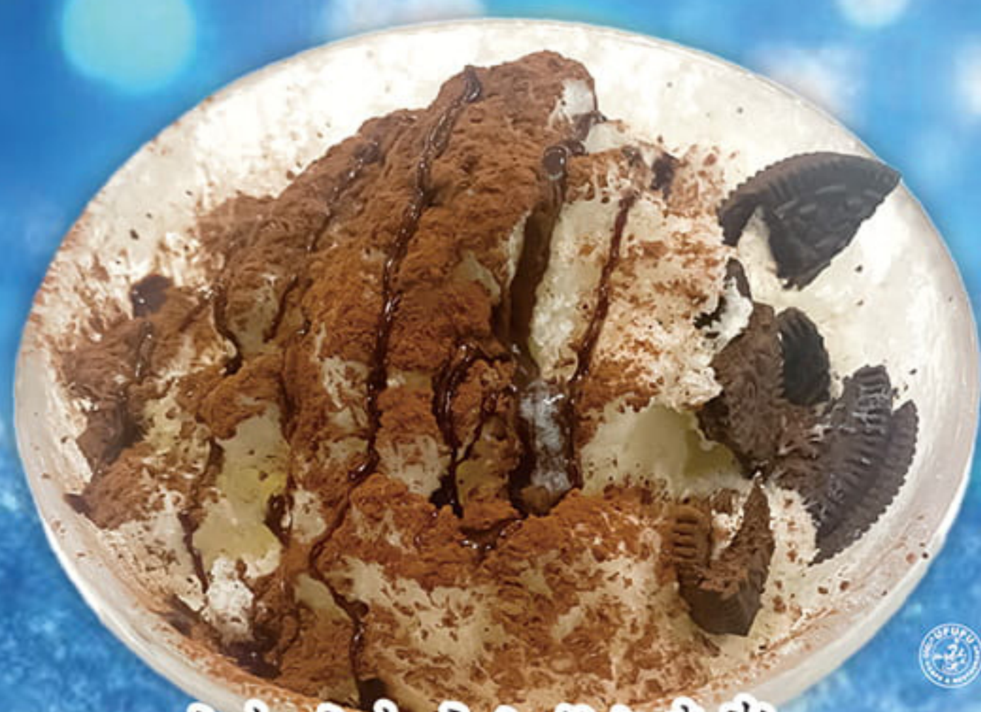
ふわふわミルクかき氷 チョコオレオ ¥980 (税込¥1,078)