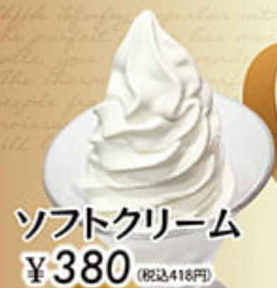
ソフトクリーム ¥380 (税込418円)