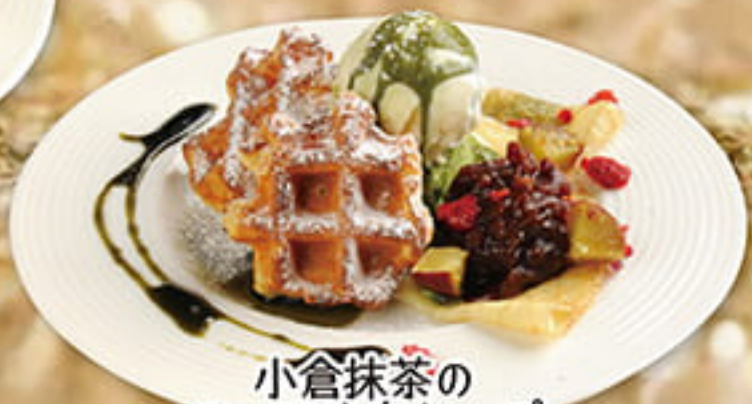
小倉抹茶の ワッフルクレープ