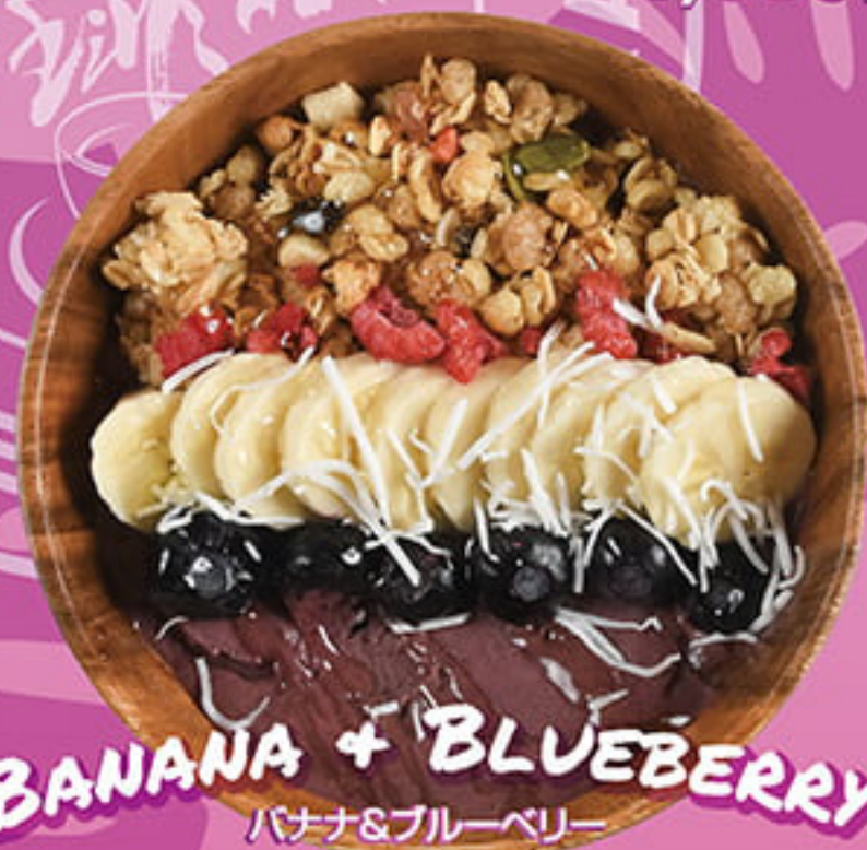
BANANA + BLUEBERRY