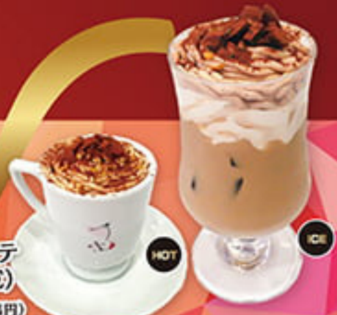
HOT ICE モンブランラテ (HOT/ICE) ¥540 (税込594円)