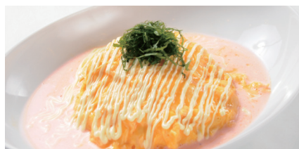
明太子クリーム オムライス ¥1,080 (税込¥1,188)