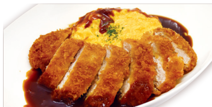
三元豚のカツオムライス ¥1,280 (税込¥1,408)