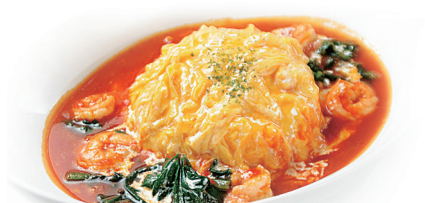
海老 & ホウレン草の トマトソースオムライス ¥1,180 (税込¥1,298)