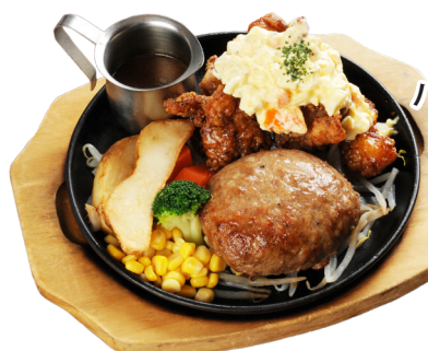
ハンバーグ&チキン南蛮