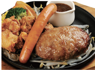
ミックスハンバーグ