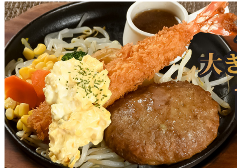
ハンバーグ&大きなエビフライ