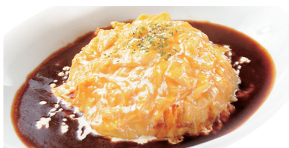
デミグラスソースオムライス ¥980 (税込¥1,078)