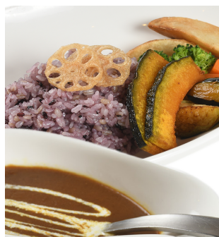
彩り野菜カレー ※もち麦使用 ※白米に変更可 ¥1,080 (税込¥1,188)