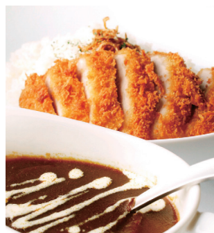
三元豚の ロースカツカレー ¥1,180 (税込¥1,298)