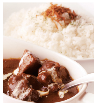
うふふ 煮込みビーフカレー ¥1,080 (税込¥1,188)