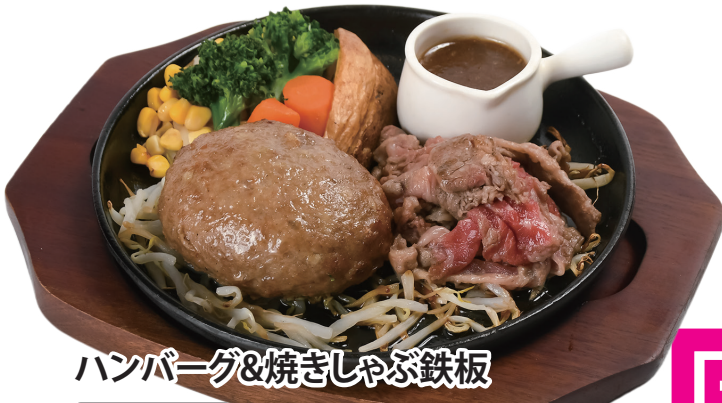
ハンバーグ&焼きしゃぶ鉄板

オリジナルソース (てりやき) or ジャポネソース ¥1,380 (税込¥1,518)