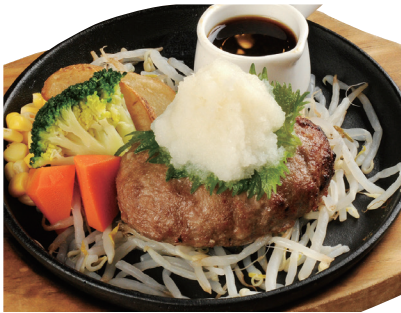
おろしポン酢ハンバーグ