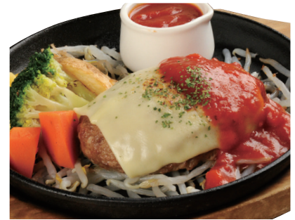
イタリアンチーズハンバーグ