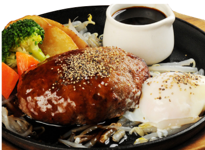
てりたまハンバーグ