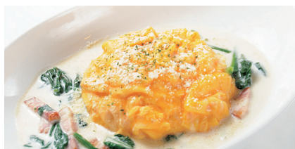
ベーコン & ホウレン草の ホワイトソースオムライス ¥1,180 (税込¥1,298)