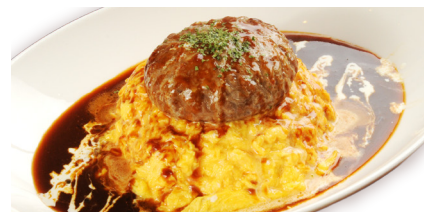
ハンバーグオムライス ¥1,280 (税込¥1,408)