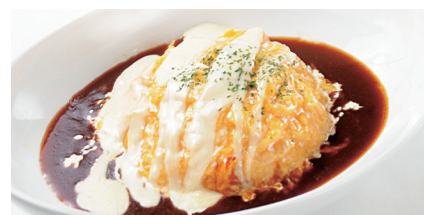
デミチーズオムライス ¥1,080 (税込¥1,188)