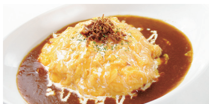
カレーオムライス ¥1,100 (税込¥1,210)