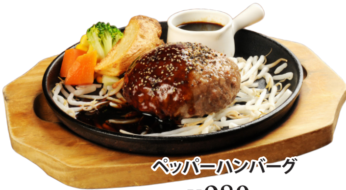
ペッパーハンバーグ