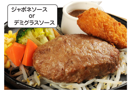
ハンバーグ&クリームコロケ