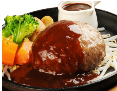
デミグラスソースハンバーグ