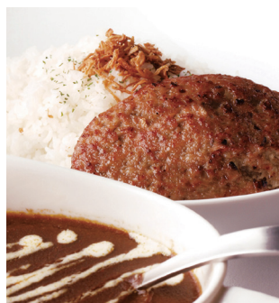
うふふ ハンバーグカレー ¥1,080 (税込¥1,188)