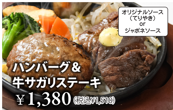
ハンバーグ&牛サガリステーキ