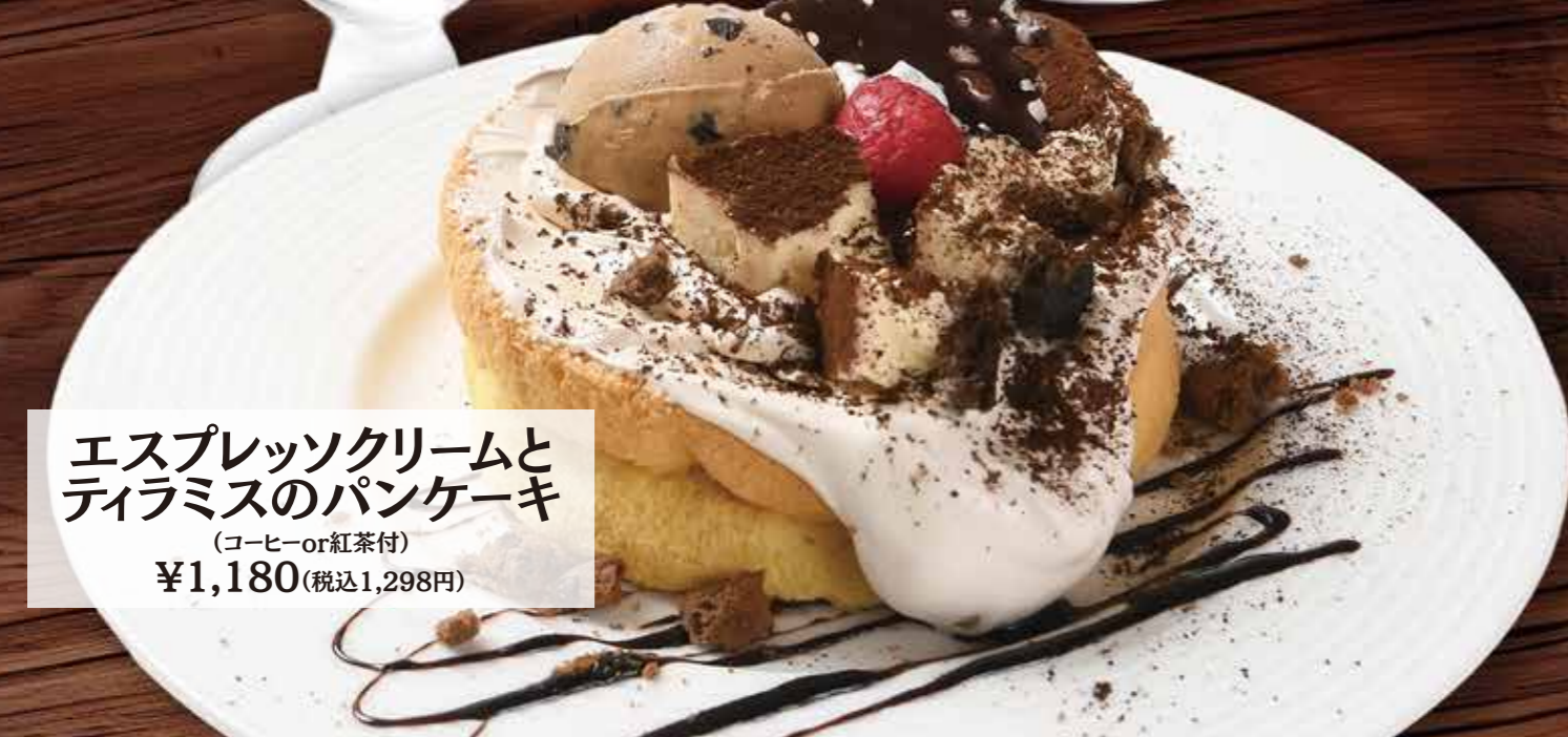
エスプレッソクリームと ティラミスのパンケーキ (コーヒーor紅茶付) ¥1,180(税込1,298円)