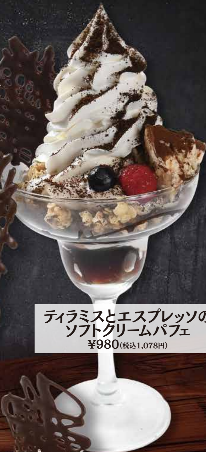
ティラミスとエスプレッソの ソフトクリームパフェ ¥980(税込1,078円)