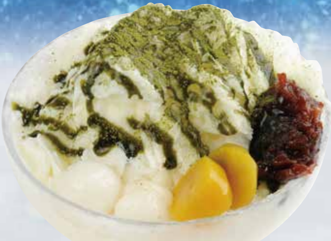
ふわふわミルクかき氷 宇治抹茶 ¥ 980 (税込¥1,078)