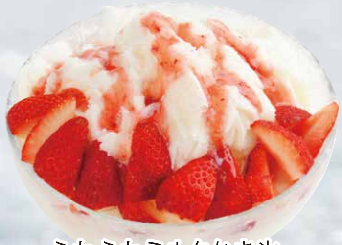
ふわふわミルクかき氷 いちご (※いちごは冷凍を使用しています。) ¥ 980 (税込¥1,078)