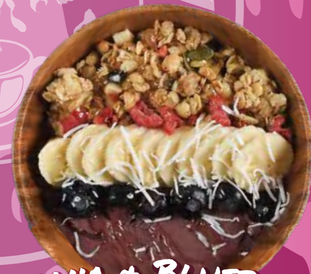
BANANA + BLUEBERRY