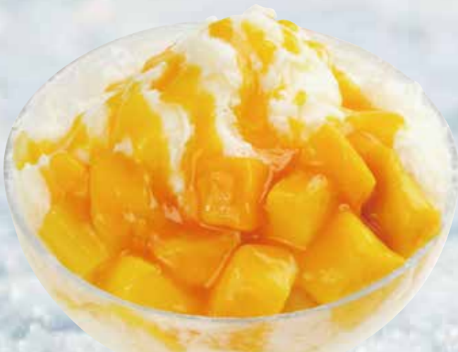
ふわふわミルクかき氷 トロピカルマンゴー ¥ 980 (税込¥1,078)