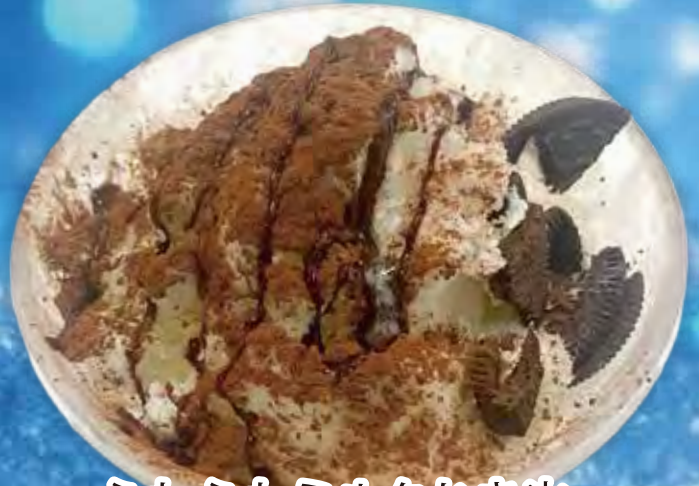
ふわふわミルクかき氷 チョコオレオ ¥ 980 (税込¥1,078)