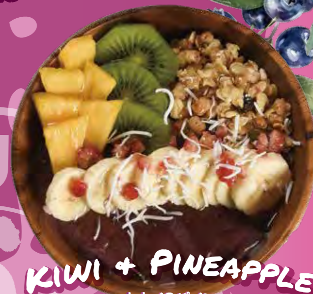
KIWI + PINEAPPLE