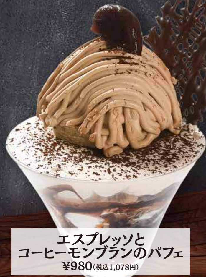
エスプレッソと コーヒーモンブランのパフェ ¥980(税込1,078円)